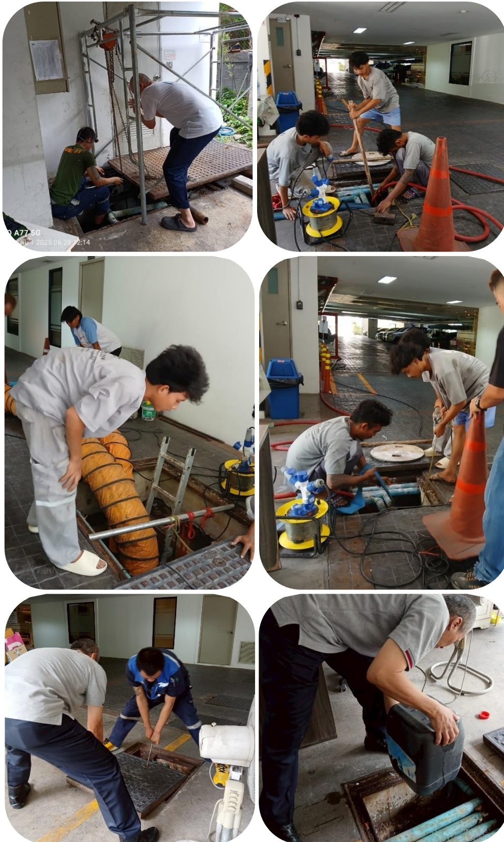
ภาพที่ 3.2-1 การดูแลระบบท่อบำบัด