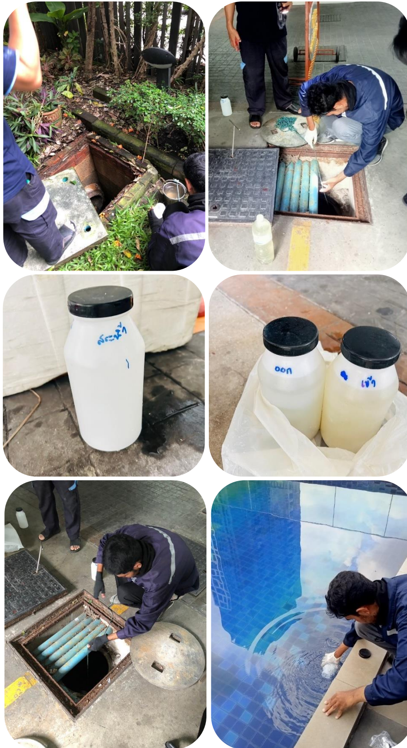
ภาพที่ 3.2-1(1) เก็บตัวอย่างน้ำบ่อบำบัดโครงการส่งตรวจสอบ